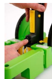
Insertar pila y accionar flujo aire